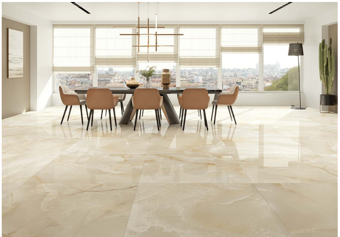
Floor Tile / Paving ONIX BEIGE 120 X 120 REC. NPLUS.

Esta nueva colección de mármol en dos tonos ha sido cuidadosamente diseñada para destacar la personalidad de la materia. El resultado es un conjunto de piezas que otorgan elegancia, pureza y armonía: tres sensaciones únicas para una nueva idea de hogar.