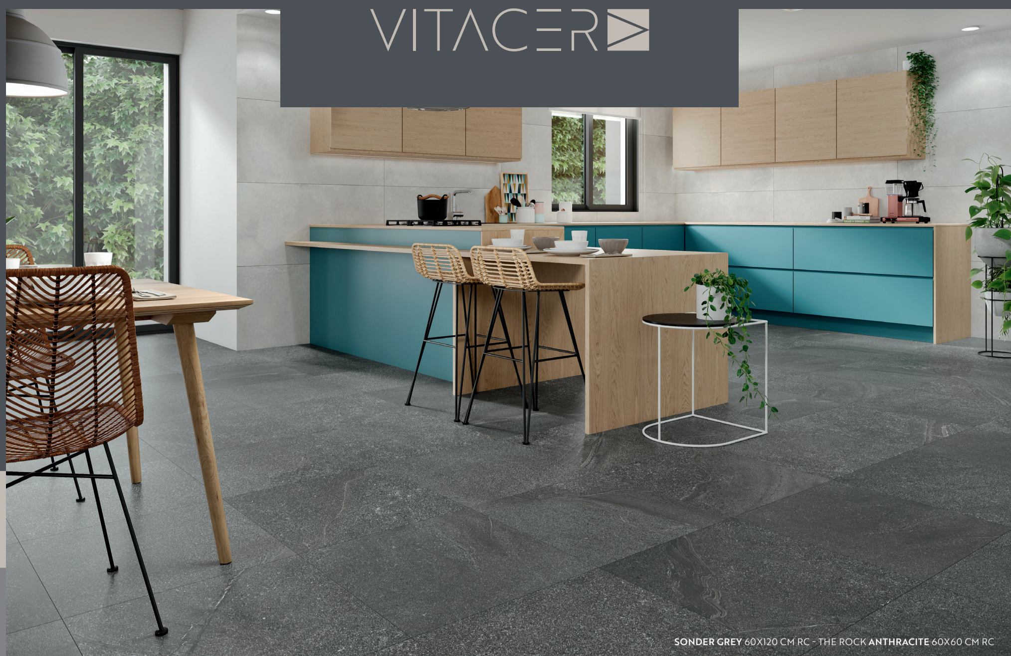
SONDER GREY 60X120 CM RC - THE ROCK ANTHRACITE 60X60 CM RC