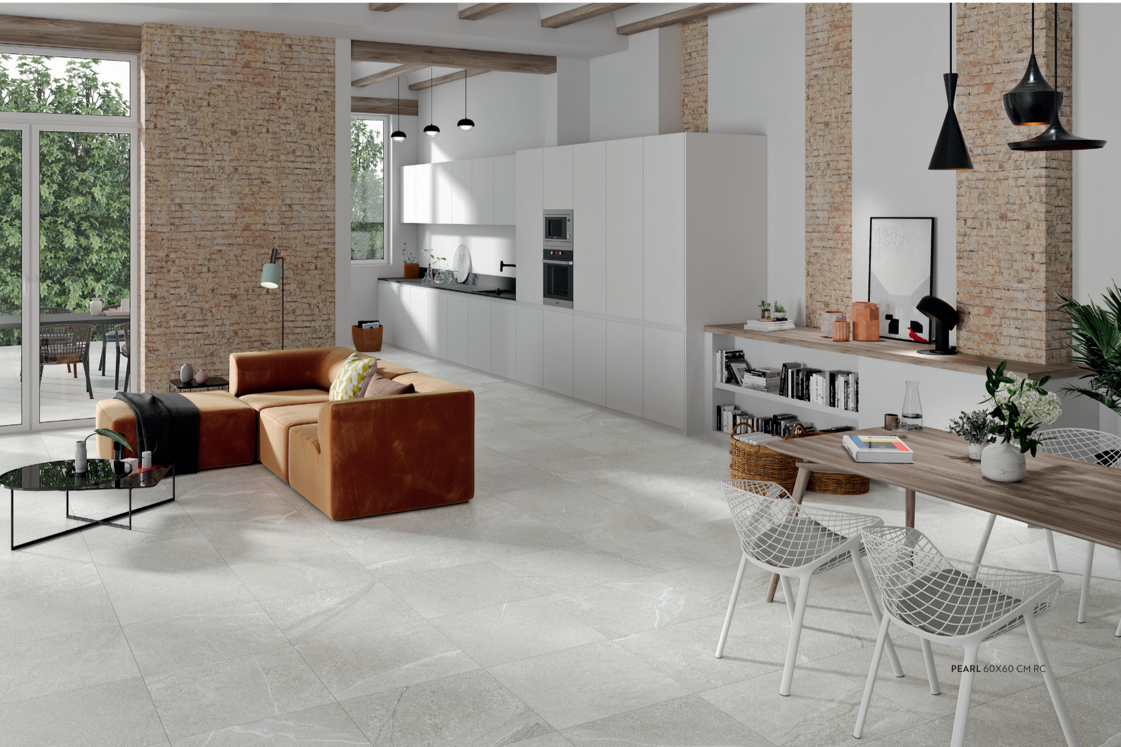
PEARL 60X60 CM RC