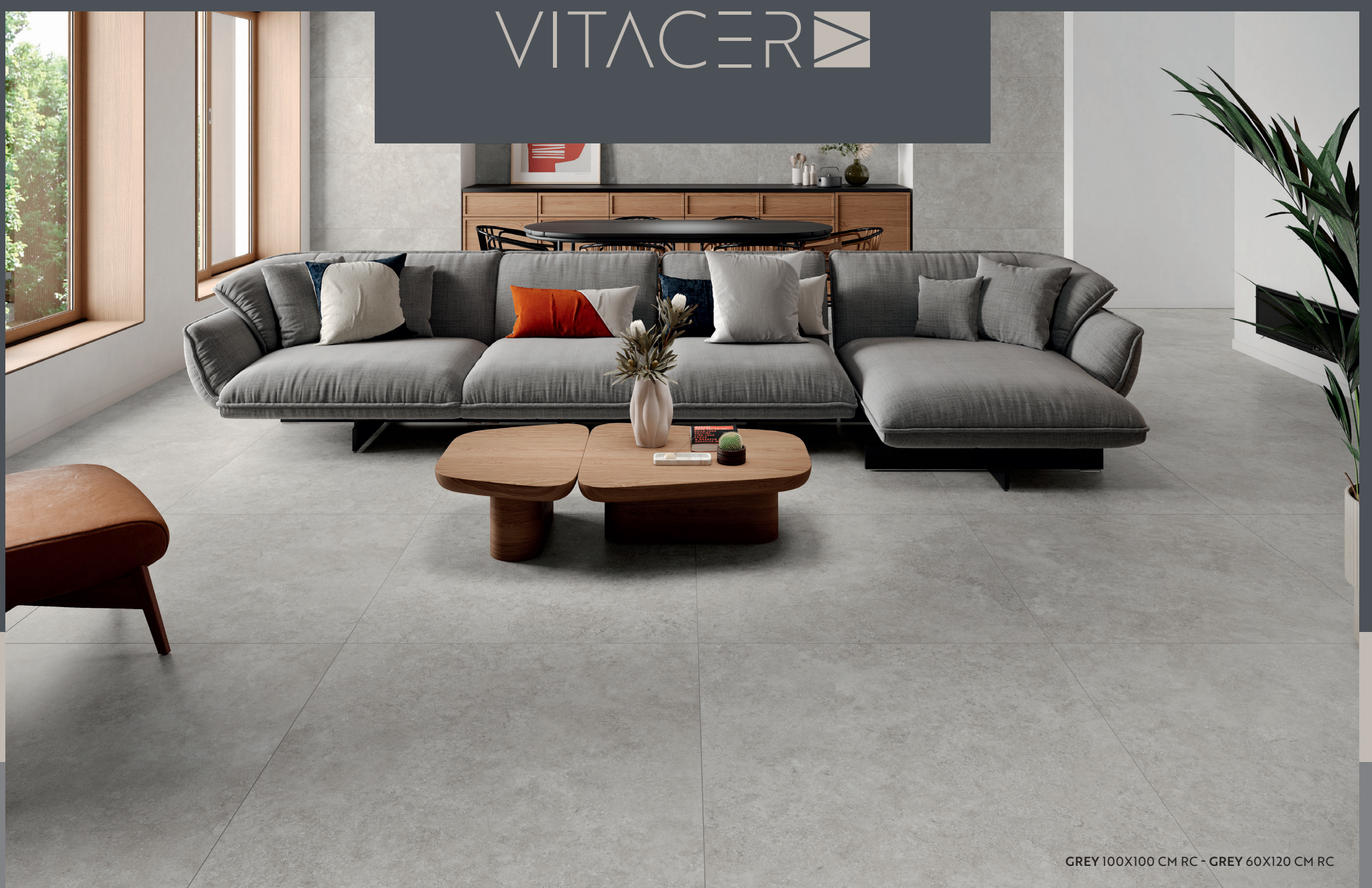
GREY 100X100 CM RC - GREY 60X120 CM RC