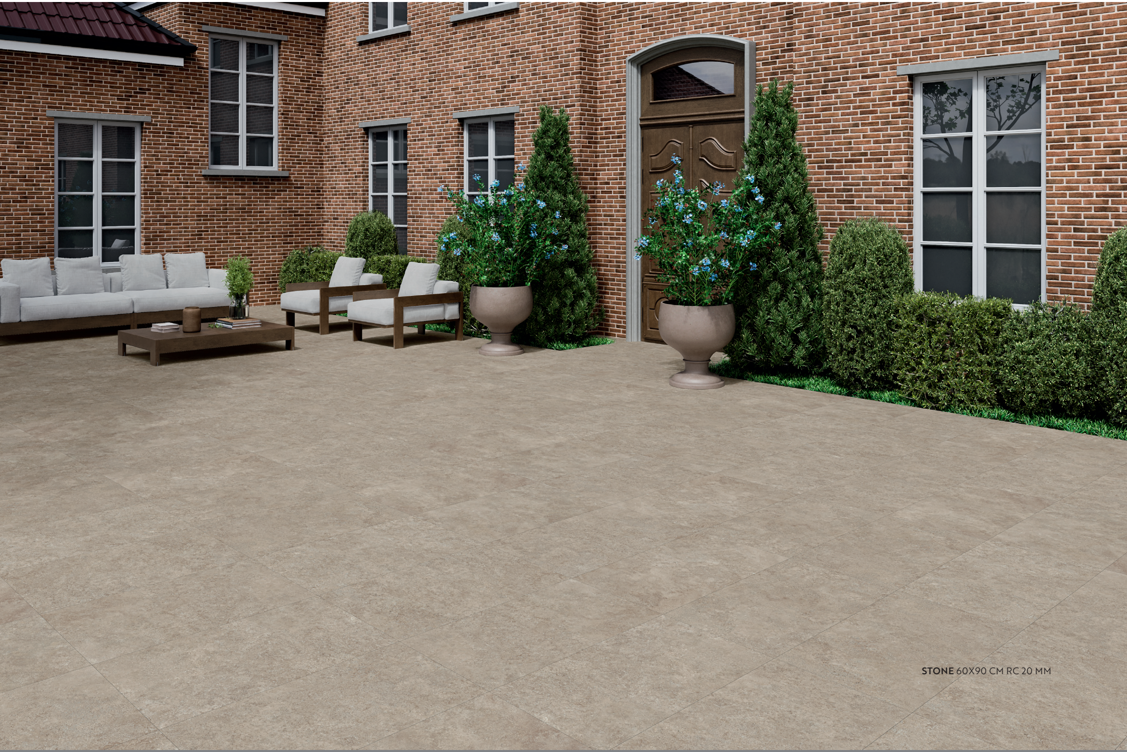
STONE 60X90 CM RC 20 MM