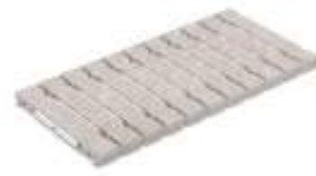
Rejilla de drenaje RJ25 FLEX · Drain grate RJ25 FLEX

Goma para rejilla 9710 incluida Grate rubber 9710 included