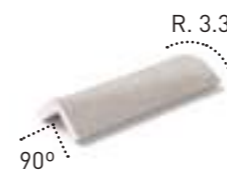
Cantonera transición exterior External transition corner