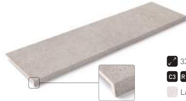
Peldaño recto · Recto step