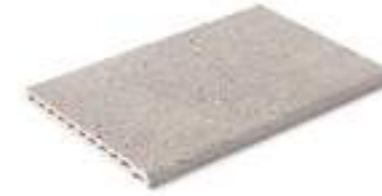
Borde Creta · Creta edge