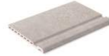
Borde Maui · Maui edge