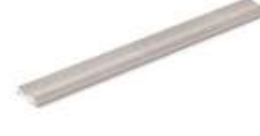
Media caña interior Inner trim