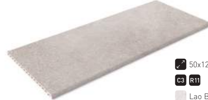
Borde Samoa · Samoa edge