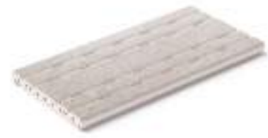
Rejilla de drenaje RJ25 · Drain grate RJ25