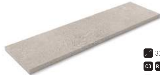
Peldaño recto tapa · Recto step corner