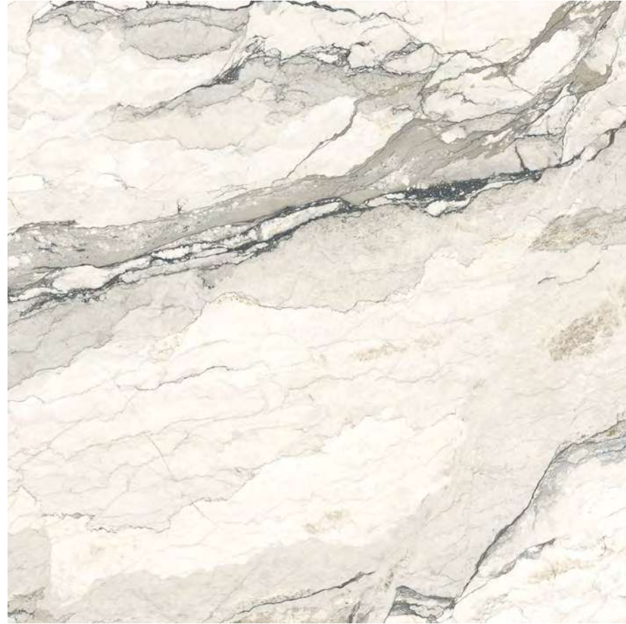
BRECCIA LUNARE POLISHED