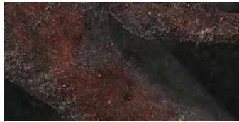
MICHIGAN RED 60 X 120 / 24" X 48" REC. LAP. N1382