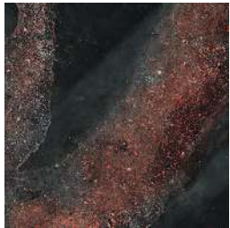
MICHIGAN RED 90 X 90 / 36" X 36" REC. LAP. N982