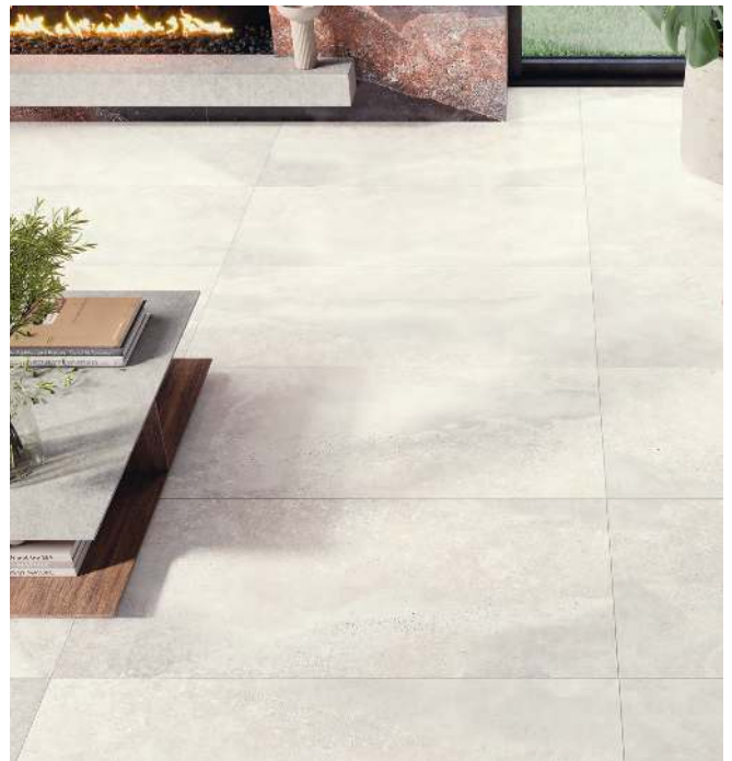
Floor Tile / Paredes MICHIGAN WHITE 60 X 120 REC. LAP