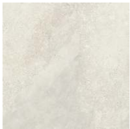
MICHIGAN WHITE 90 X 90 / 36" X 36" REC. LAP. N982