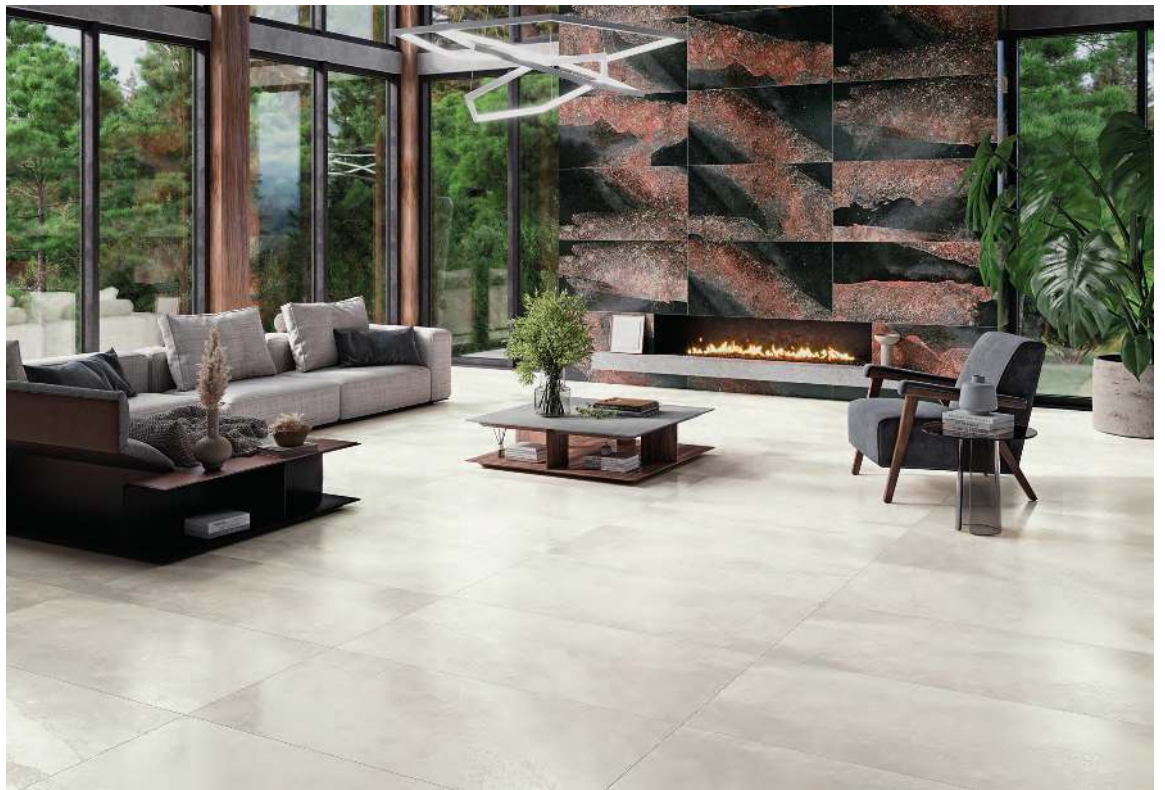
Wall Tile / Revestimiento MICHIGAN RED 60 X120 REC LAP Floor Tile / Pavingstone MICHIGAN WHITE 60 X120 REC LAP

Los granitos se forman a partir de magmas solidificados y estos, a su vez, pueden tener orígenes diferentes. La serie Michigan se inspira en el granito americano Dakota Mahogany, que tiene un color marrón rojizo y ligeras intrusiones negras. Su acabado de granilla lapada le concede un brillo satinado muy resistente al rayado y a las manchas. El color blanco es muy luminoso y hace que las estancias se vean más grandes.