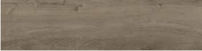
FOREST NATURAL 758055 30x120 (11 3/4 "x47 1/4 ")