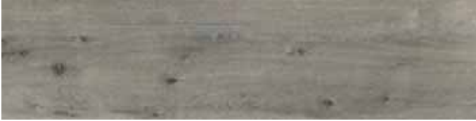
FOREST ASH 758057 30x120 (11 3/16 "x47 1/2 "