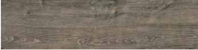
FOREST BROWN 758056 30x120 (11 3/16 "x47 1/2 "