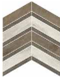
DECORO 2 B 758376 30x30 (11 3/4" x11 3/4" ) White/Natural/Brown