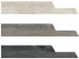
DECORO 1 A 758373 10x70 (4"x27 5/8" ) White/Ash/Dark 12 PZ/BOX