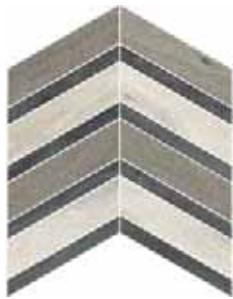
DECORO 2 A 758375 30x30 (11 3/4" x11 3/4" ) White/Ash/Dark