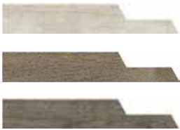
DECORO 1 B 758374 10x70 (4"x27 5/8" ) White/Natural/Brown 12 PZ/BOX

schemi di posa / laying scheme / schéma de pose Verlegungsschemen / esquema de colocación / схема укладки