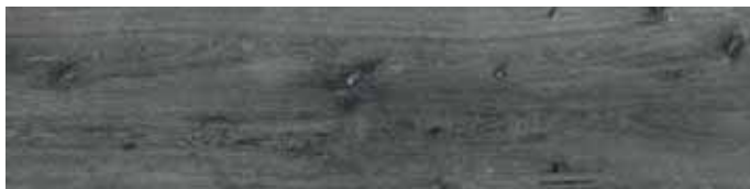
FOREST DARK 758058 30x120 (11 3/16 "x47 1/2 "