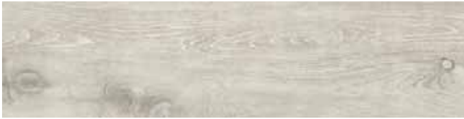
FOREST WHITE 758054 30x120 (11 3/16 "x47 1/2 "